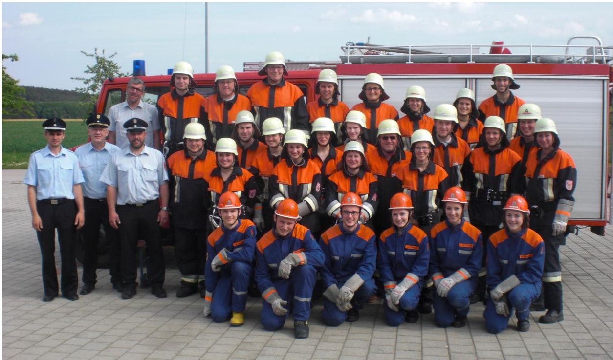
Bild: Die erfolgreichen Prüflinge mit Prüfern und Kommandant