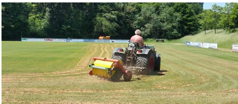
Der Sportplatz wird auf die neue Saison vorbereitet

Die Fußballabteilung des FC Hitzhofen-Oberzell möchte sich bei allen Fans, Sponsoren und Gönnern für die tolle Unterstützung während der abgelaufenen Saison bedanken! Wir würden uns natürlich sehr freuen, wenn das in der neuen Saison ungebrochen anhalten würde!