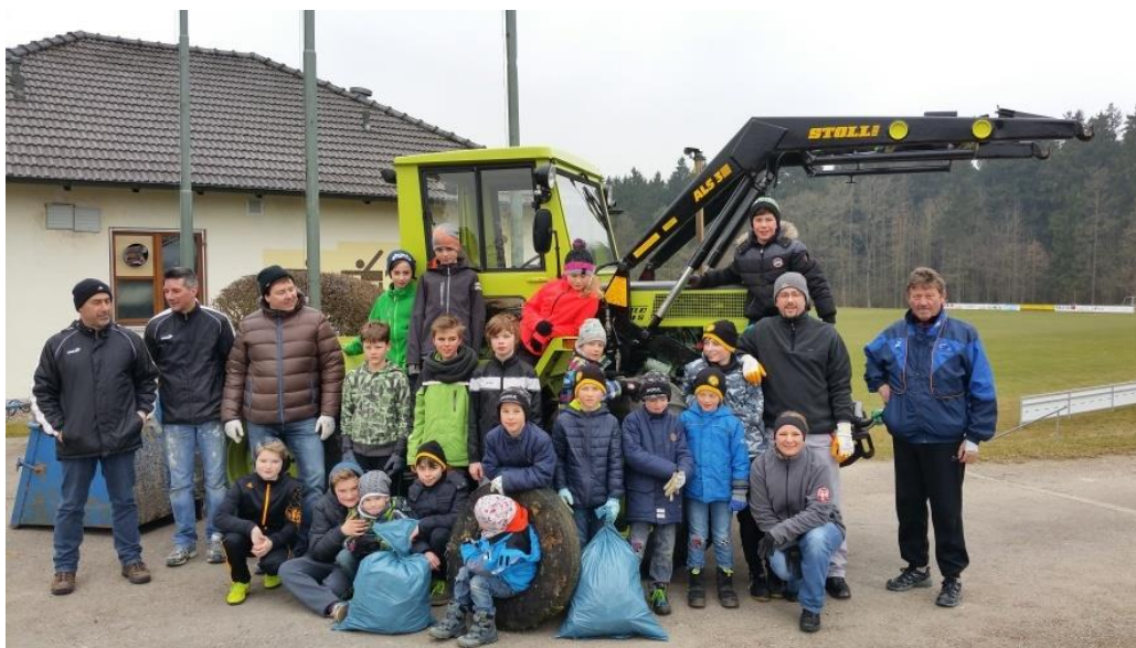
Jungkicker mit Betreuern beim Ramadama